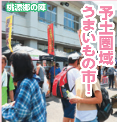
おながが空いたら予土圏域のうまいものを堪能しよう！