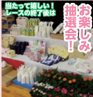
ゼッケン番号による松野町の特産品をはじめとした楽しい賞品が当たる大抽選会です。