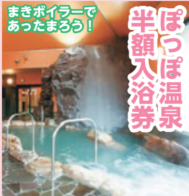
疲れた体を癒すのにぜひご利用ください。